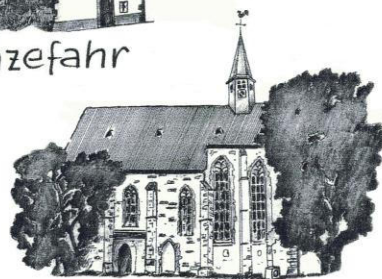
Mariae Himmelfahrt Stausebach