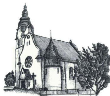
St. Matthäus Sindersfeld